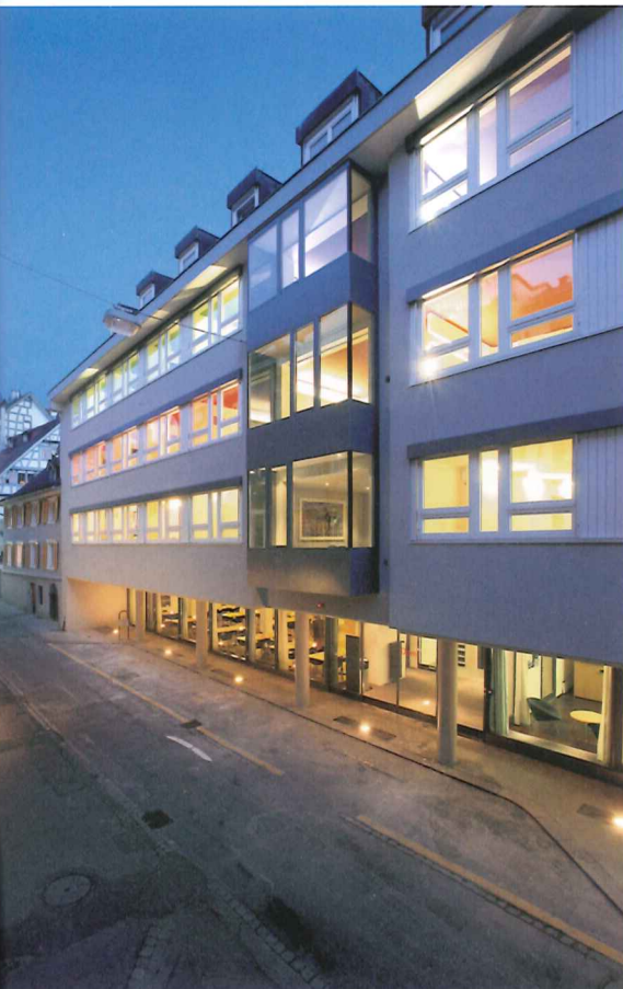
^ Jedem Geschoss seine Farbe: Das neue Innenleben des «Dom» zeichnet sich auch aussen ab.

✓ 2. Obergeschoss: Die kleinteilige Struktur des Grundrisses blieb erhalten.